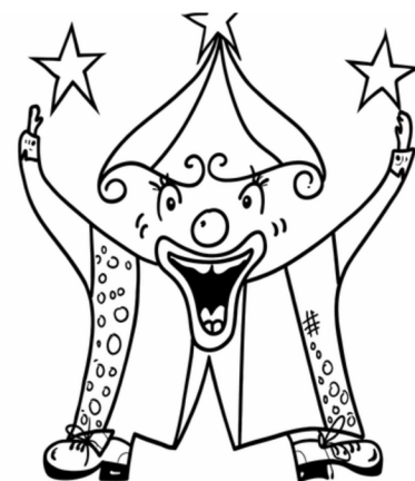
Premier logo des PPNs !

Une chose est sûre : "Pourquoi pas nous !" continue de rêver grand, et d'écrire son histoire.